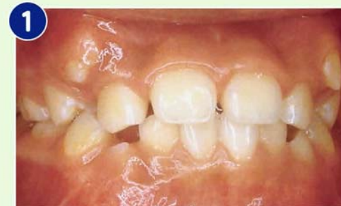
1 3|3の萌出余地不足が心配されるが経過観察