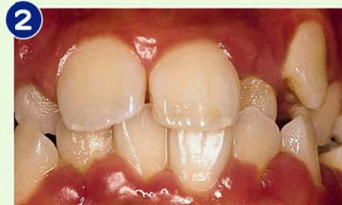
2 叢生：歯冠幅径の1/4以上が重なっている