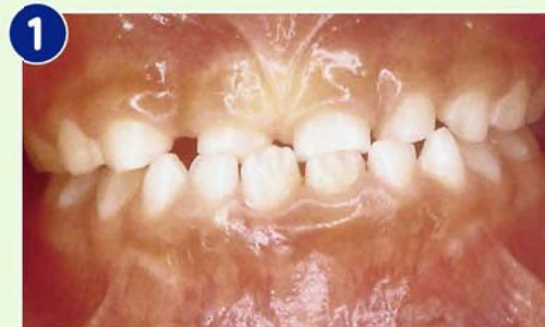
1 前歯部が反対咬合であるが、永久歯交換まで経過観察