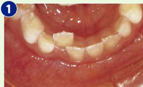
1 2|が舌側転位しているが経過観察