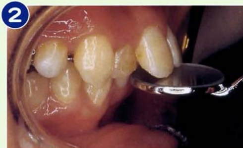
2 上顎前突：オーバージェット7~8mm以上 (デンタルミラーの直径の1/2程度)