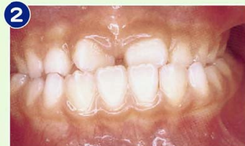
2 下顎前突：2歯以上の反対咬合