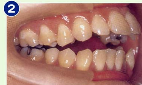
2 開咬：上下切歯間に6mm以上空隙 (デンタルミラーのホルダーの太さ)