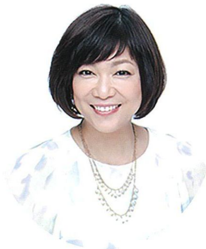
堀 ちえみ さん